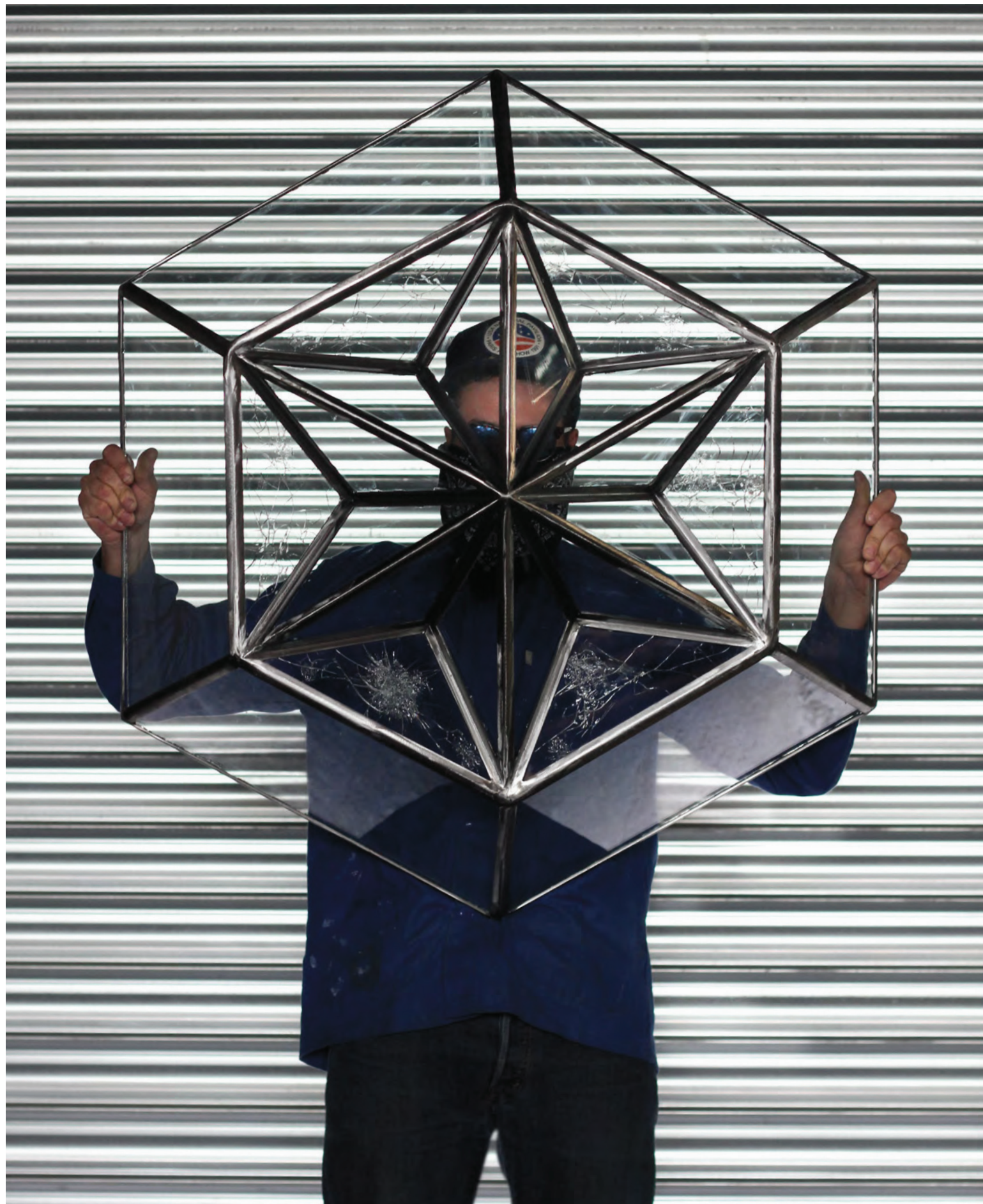
Le Diamantaire: diamant Sungold , acier, miroir jaune, vert et argent, 100 x 100 x 25 cm, 2016 (page de gauche).