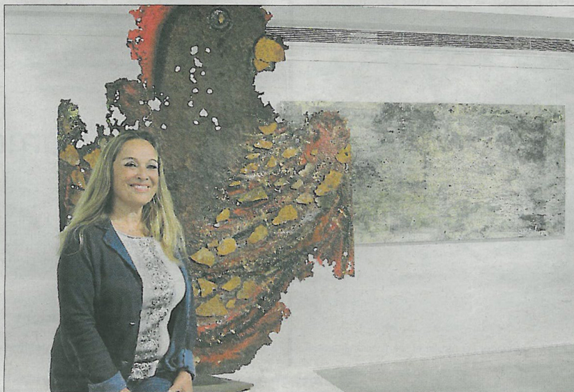
La artista junto a una de sus obras y, de fondo, un cuadro que recibió un premio en París.