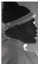
VIDEO OF THE DAY ] MELO-X - HANDLE IT