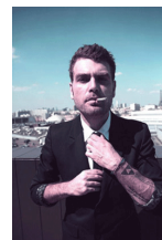
THE TOXIC AVENGER - ROMANCE AND CIGARETTES EP