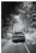
VIDEO OF THE DAY : JAMES BLAKE FEAT CHANCE THE RAPPER