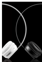
AIR BEATS HEADPHONES